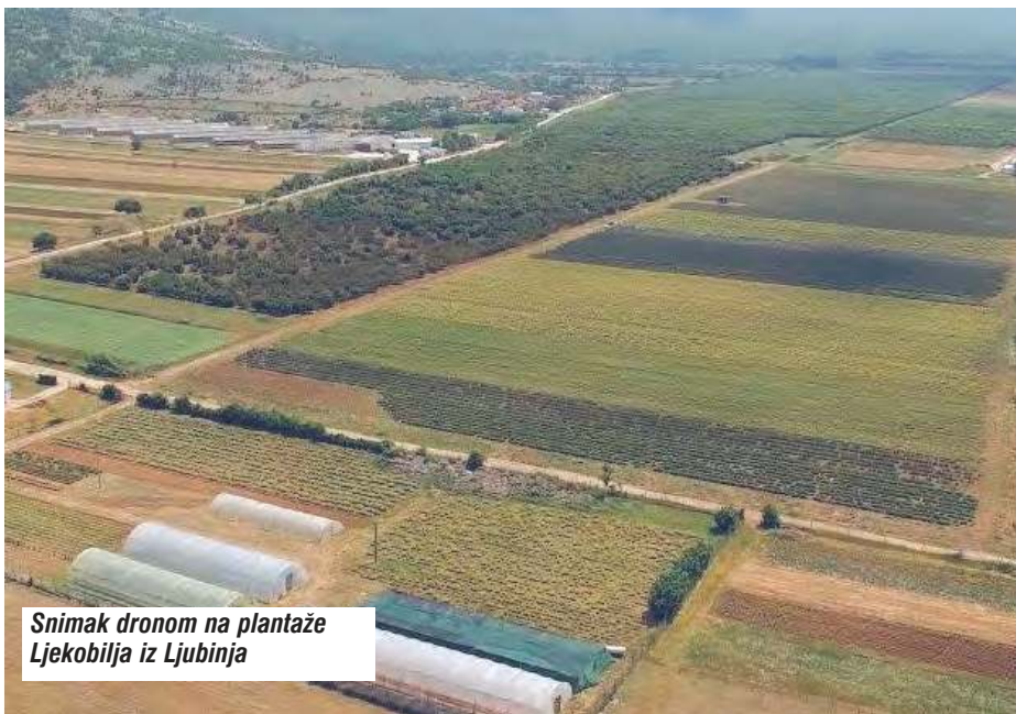
Snimak dronom na plantaže Ljekobilja iz Ljubinja

Naš cilj je da sa širokom paletom životno korisnih proizvoda zadovoljimo upravo takve potrebe naših korisnika i da konstantno težimo ka većem i boljem kvalitetu, kako naših proiz-